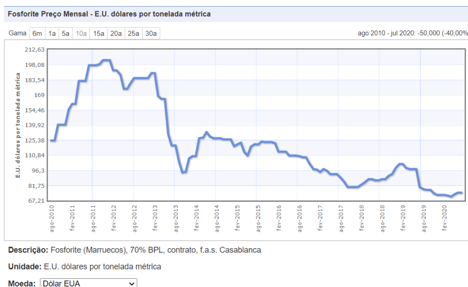
Figura 1. Gráfico da variação de preço do concentrado de fosfato nos últimos 10 anos.

No ano de 2020, o preço do concentrado de fosfato está nos menores níveis dos últimos 10 anos, com média de US$ 73 por tonelada conforme figura 2 1 .